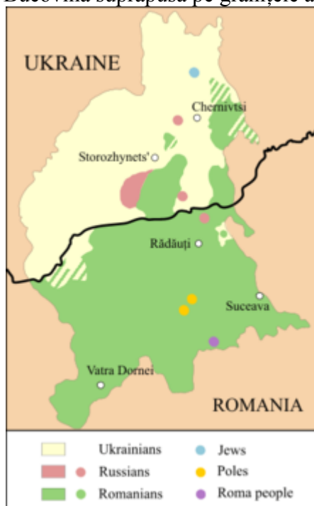
Harta etnică a Bucovinei 2002